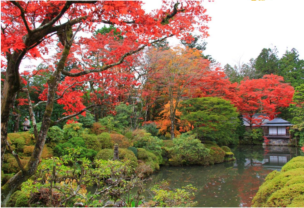
日光山輪王寺 逍遙園 見頃(11月8日撮影)