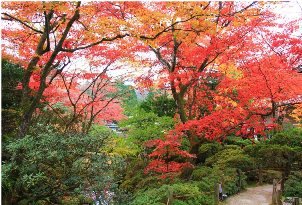
日光山輪王寺 逍遙園 見頃(11月8日撮影)