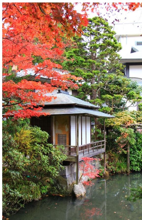
日光山輪王寺 逍遙園 見頃(11月8日撮影)