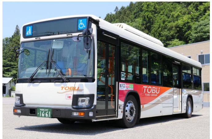
急行バス運行車両（イメージ）