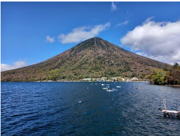
中禅寺湖畔から望む男体山