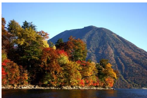
△中禅寺湖エリアの紅葉の様子