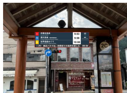
△「バス現在位置情報検索サービス」画面およびデジタルサイネージ（イメージ）