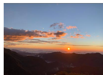
△明智平展望台からの景色