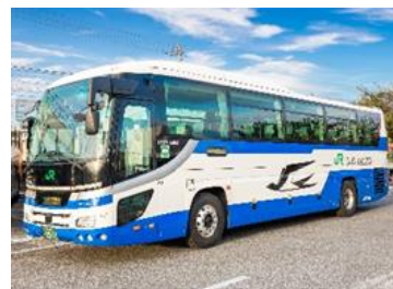
ジェイアールバス関東

当路線は、近年急速に発展し続けている「柏の葉」、子育て世帯から住みやすい街として注目を集めている「流山おおたかの森」と東京駅を乗り換えなしで繋ぐ新路線です。