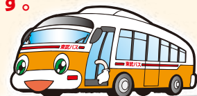
エコバスらぶちゃん

※東武バス日光管内、深夜急行バス、空港連絡バス、高速バス、コミュニティバス、他社のバスではご利用いただけません。 東武バスセントラルが運行する足立区はるかぜ号、草加市パピポルクンバス、八潮市コミュニティバスはご利用いただけます。 ※払戻しの場合、ご購入日にかかわらず、4月1日からの往復分の区間運賃と手数料を差し引いた額が払戻し額となります。 このため、4月1日より概ね4ヶ月を超えますと払戻し額が発生しない可能性があります。