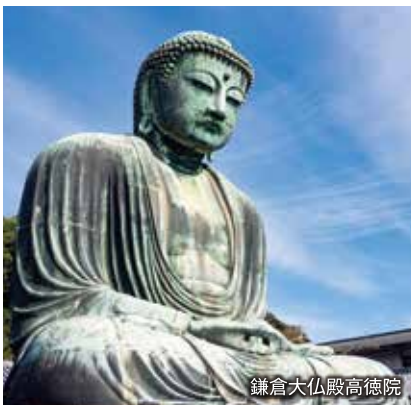
鎌倉大仏殿高德院