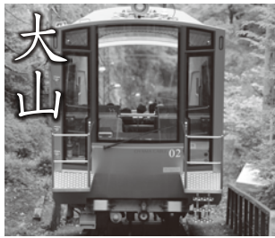
本厚木駅から小田急線・バス・ケーブルカーで、約60分