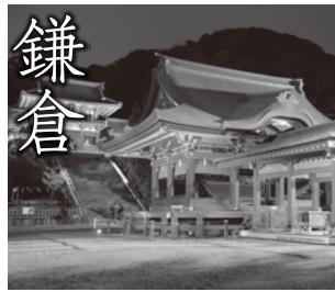
藤沢駅からJR東海道・横須賀線で、約15分 ／江ノ島電鉄で約35分