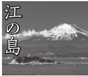
藤沢駅から江ノ島電鉄で、約11分