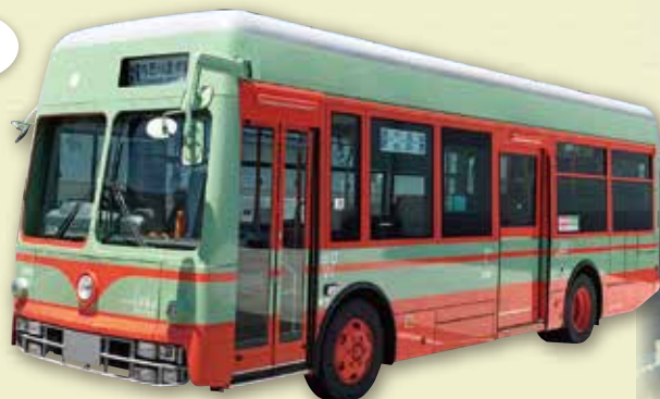
日光軌道タイプ特別車両