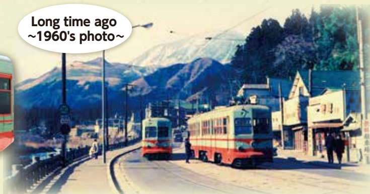
日光市内(神橋付近)を走行する日光軌道