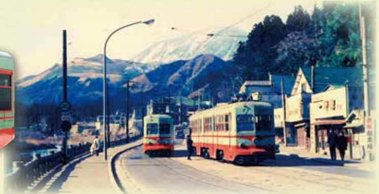
日光市内(神橋付近)を走行する日光軌道