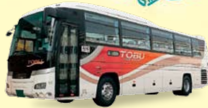
東武バスセントラル

いわき号に乗って東京へ！ 東京メトロ・都営地下鉄に乗り換えて、 ぐるっと巡れる乗り放題！！