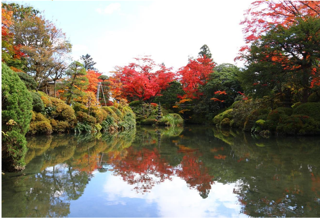
日光山輪王寺 逍遙園 見頃(11月8日撮影)