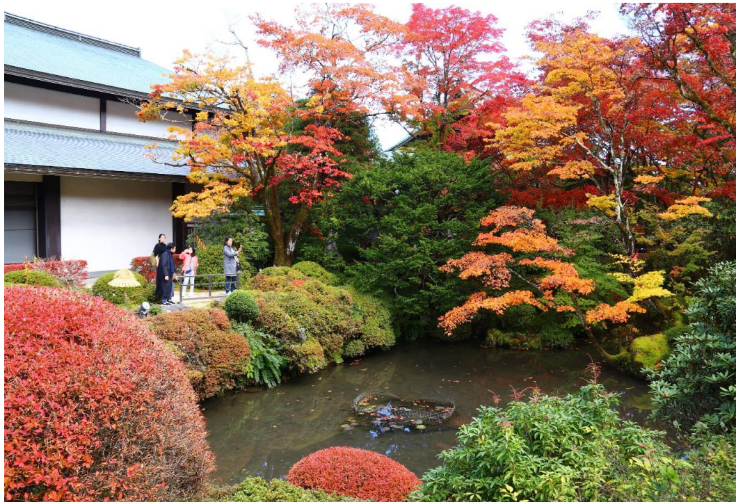
日光山輪王寺 逍遙園 見頃(11月8日撮影)