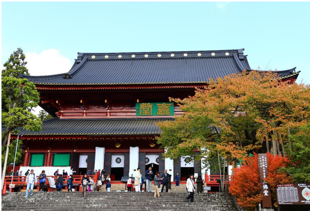
日光山輪王寺 三仏堂 (11月8日撮影) 平成の大修理をして来た三仏堂が約9年という歳月を経て、その美しさが現世に蘇りました。