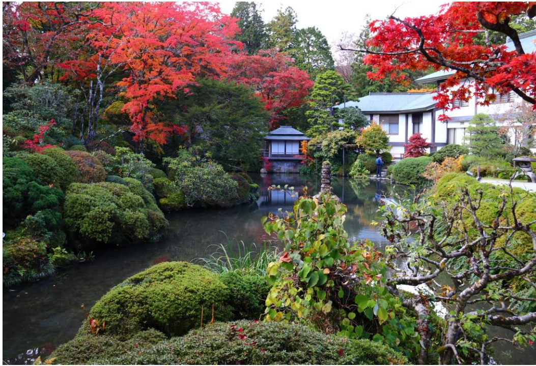
日光山輪王寺 逍遙園 見頃(11月8日撮影)