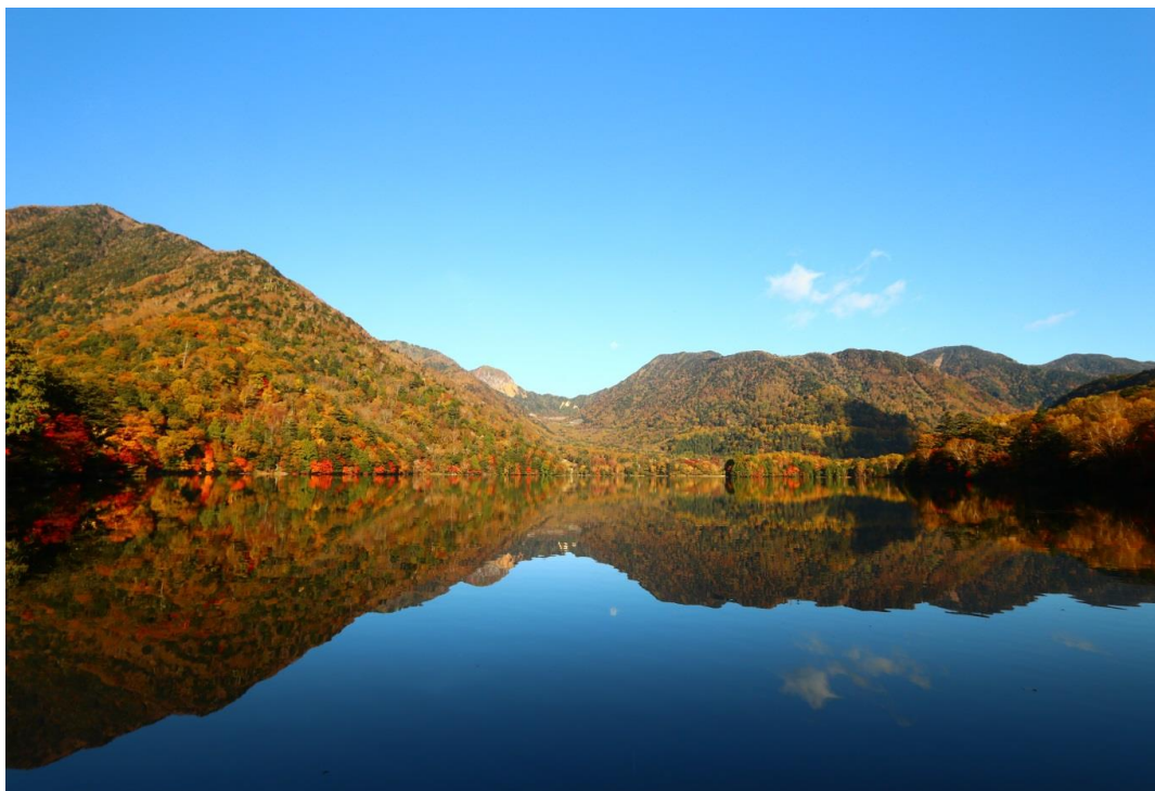
湯ノ湖 見頃(10月11日撮影) アクセス: JR・東武日光駅から東武バス湯元温泉行き乗車で、「湖畔前」停留所下車すぐです。