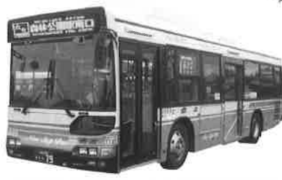
◎西文化会館入口～森林公園駅南口間は、降車のみとなります。