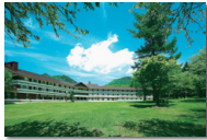
日光アストリアホテル