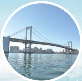
レインボーブリッジ