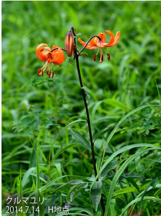
クマユリ 2014.7.14 H地点