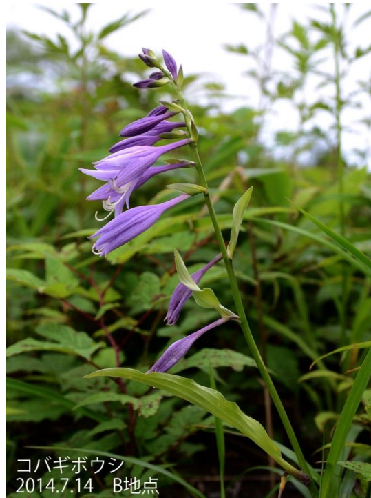
コバギボウシ 2014.7.14 B地点