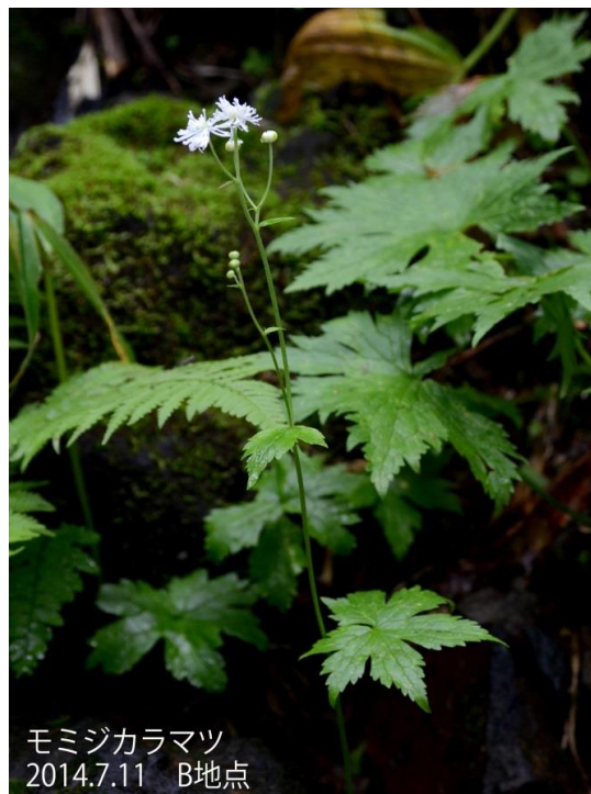
モミジカラマツ 2014.7.11 B地点