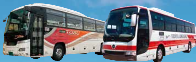
東武バスセントラル