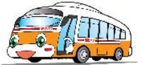
エコバスの「らぶちゃん」