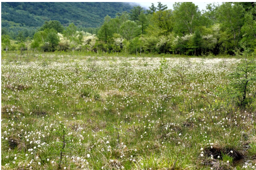
ワタスゲ見頃6月20日頃まで(2014年6月9日撮影)