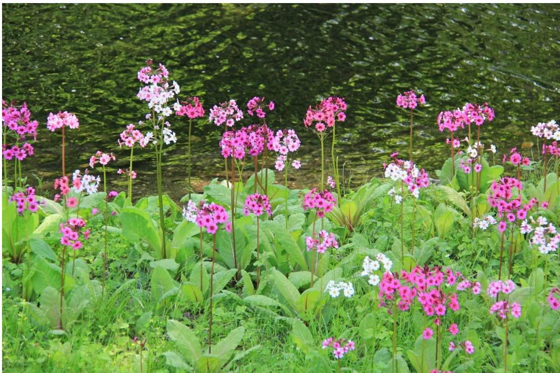
千手が浜 クリンソウ 見頃(6/4)