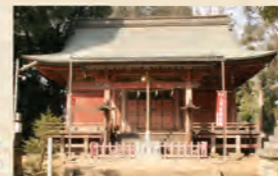
三芳野神社 ③小江戸名所めぐり乗り場 15分 博物館前