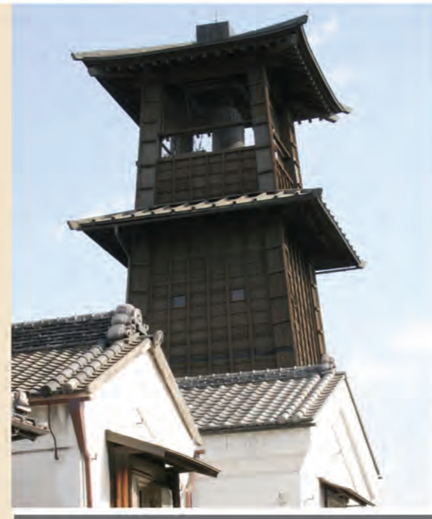
時の鐘 1②4⑤6 乗り場 7分 一番街 ③小江戸名所めぐり乗り場 12分 大手町