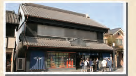
川越まつり 1②4⑤6 乗り場 8分 札の辻 ③小江戸名所めぐり乗り場 23分 札の辻