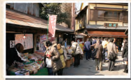
菓子屋横丁 1②4⑤6 乗り場 8分 札の辻 ③小江戸名所めぐり乗り場 23分 札の辻