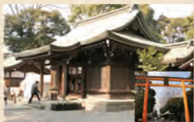
川越氷川神社 1②4⑤ 乗り場 9分 喜多院 7乗り場 10分 宮下町 ③小江戸名所めぐり乗り場 20分 宮下町