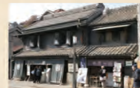
蔵造り資料館 1②4⑤6 乗り場 7分 一番街 ③小江戸名所めぐり乗り場 24分 一番街