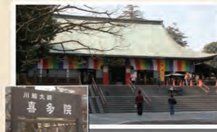
喜多院 ③小江戸名所めぐり乗り場 8分 喜多院前

蔵の街へは東武バス路線が早くて便利です! このパンフを見て、小江戸川越を満喫しましょう。