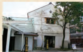
鏡山酒造跡地 1②4⑤67 乗り場 3分 本川越