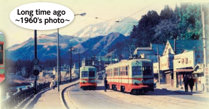
日光市内(神橋付近)を走行する日光軌道