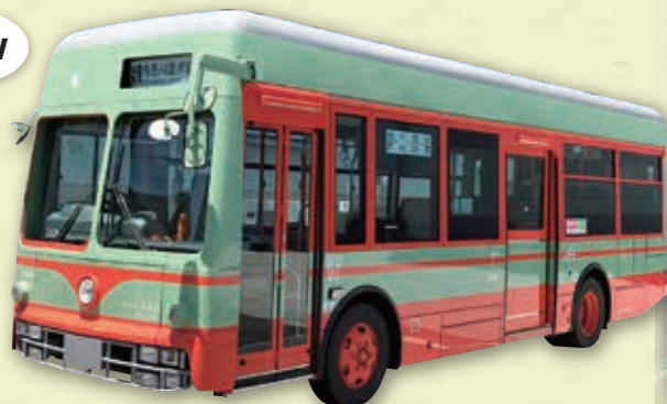
日光軌道タイプ特別車両