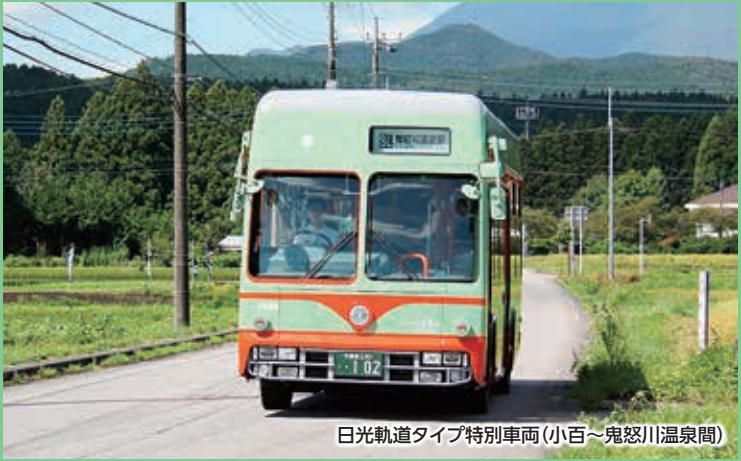
日光軌道タイプ特別車両 (小百～鬼怒川温泉間)